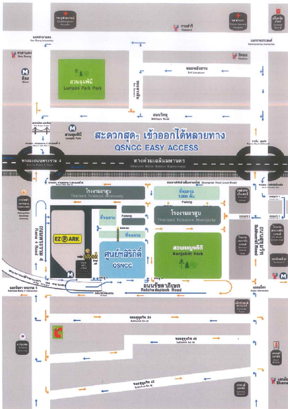
แผนที่ศูนย์ประชุมแห่งชาติสิริกิติ์