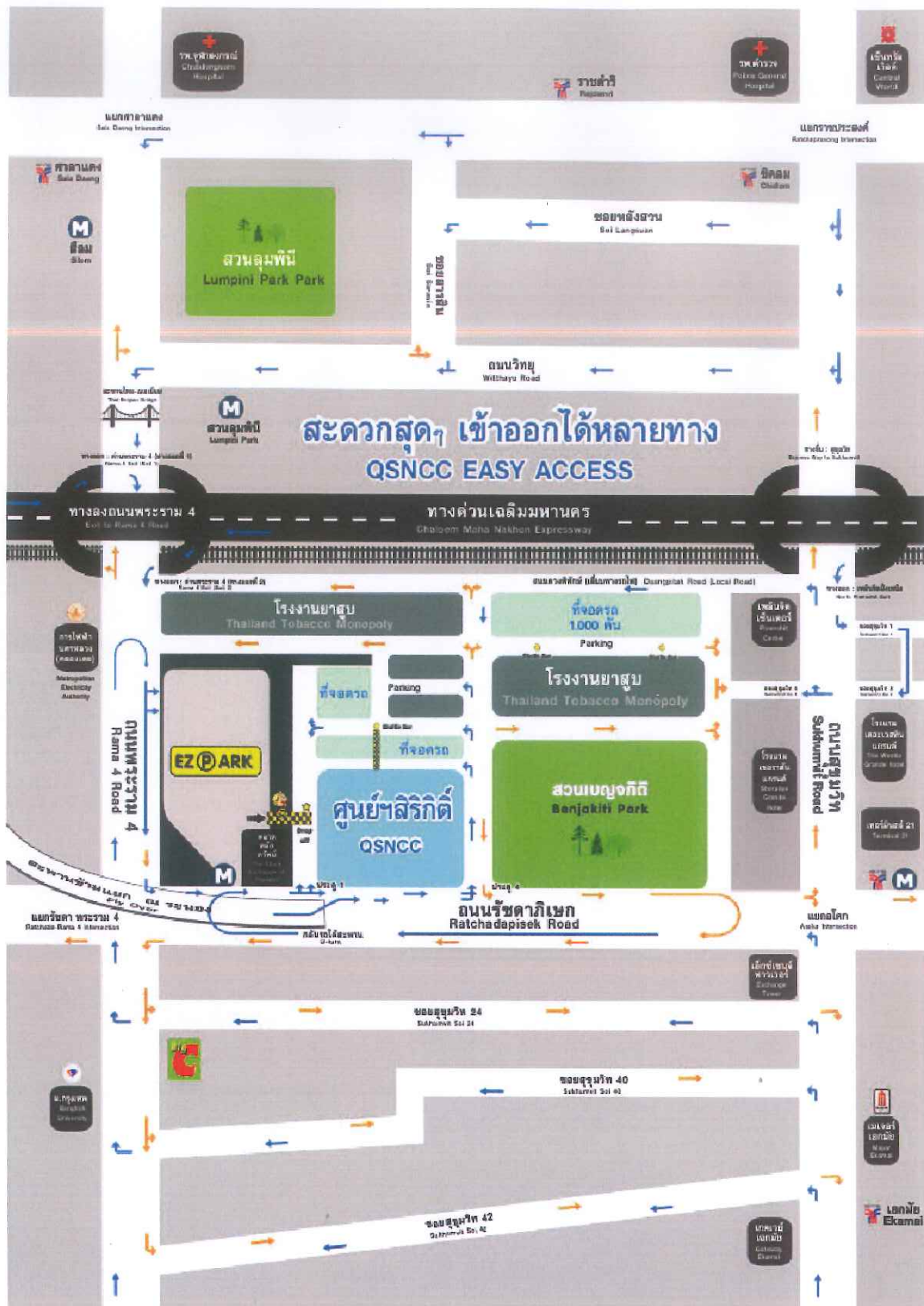
แผนที่ศูนย์ประชุมแห่งชาติสิริกิติ์